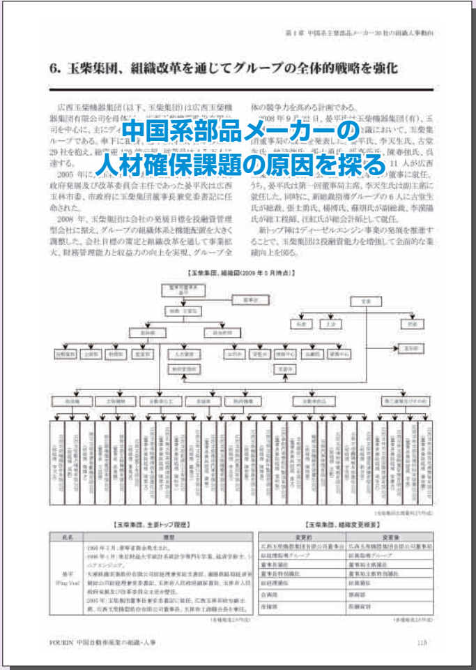
「第4章 中国系主要部品メーカー30社の組織人事動向」より