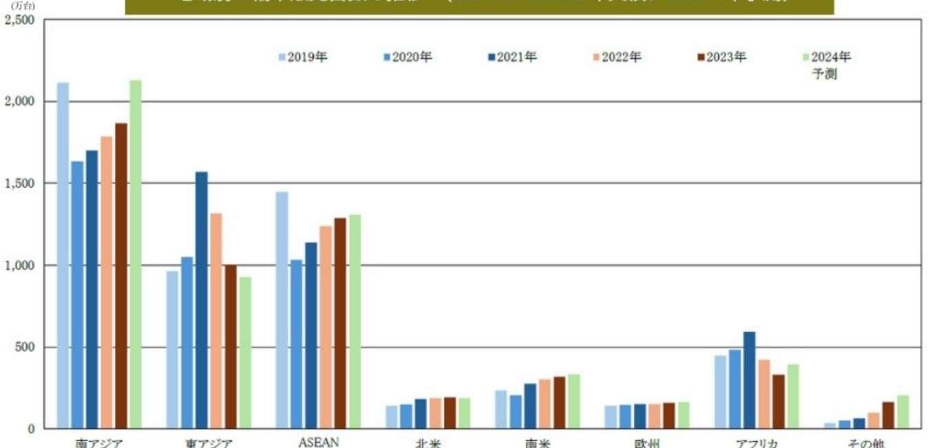
地域別二輪車販売台数の推移 (2019~2023年実績、2024年予測)

当調査報告書は書店では取り扱っておりません。お申し込み、お問い合わせは、申込書に必要事項をご記載の上、FAXまたはメール添付してください。またE-mailでのご注文も承ります。