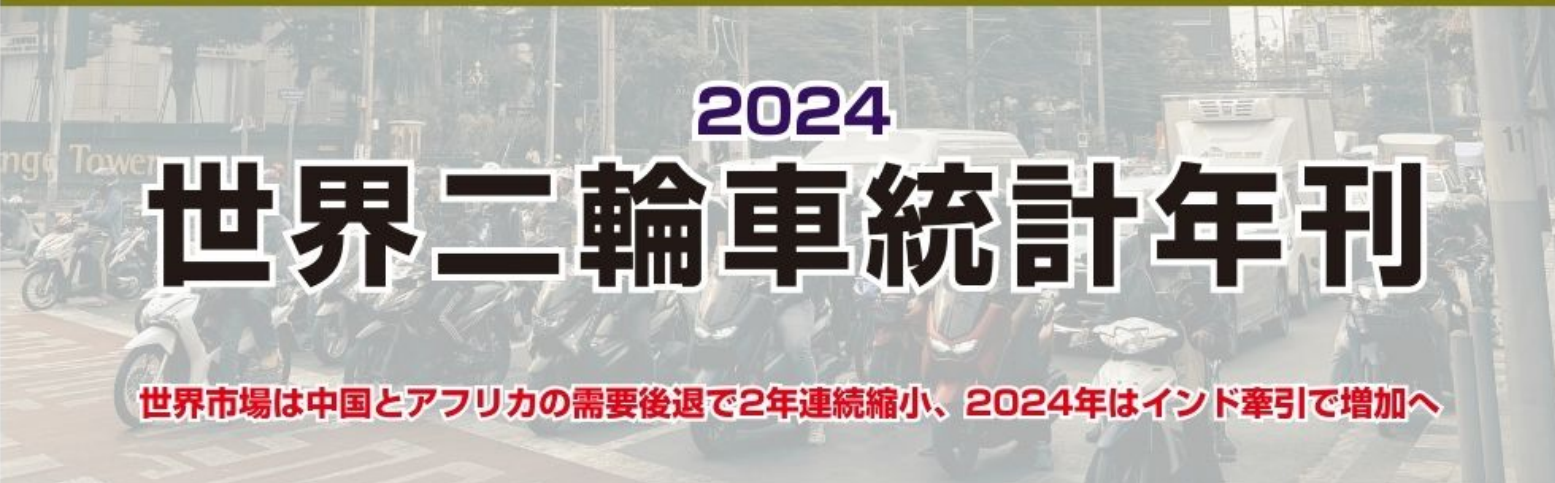
第1章 世界電動二輪車販売の概況