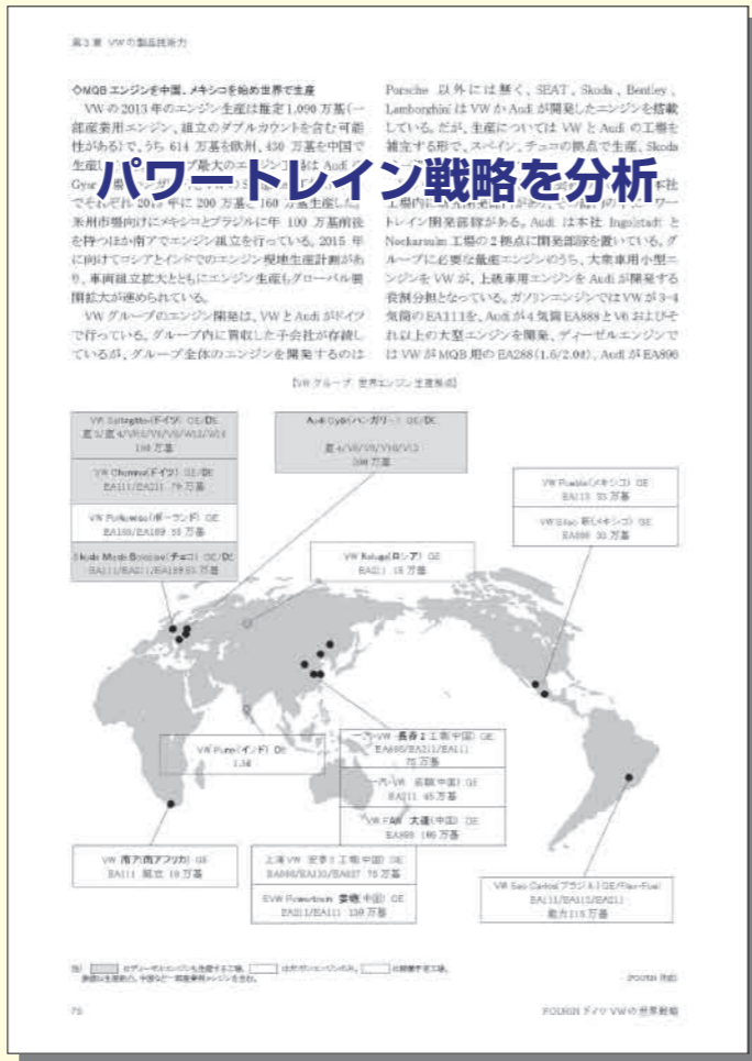
「第3章 VWの製品技術力」より